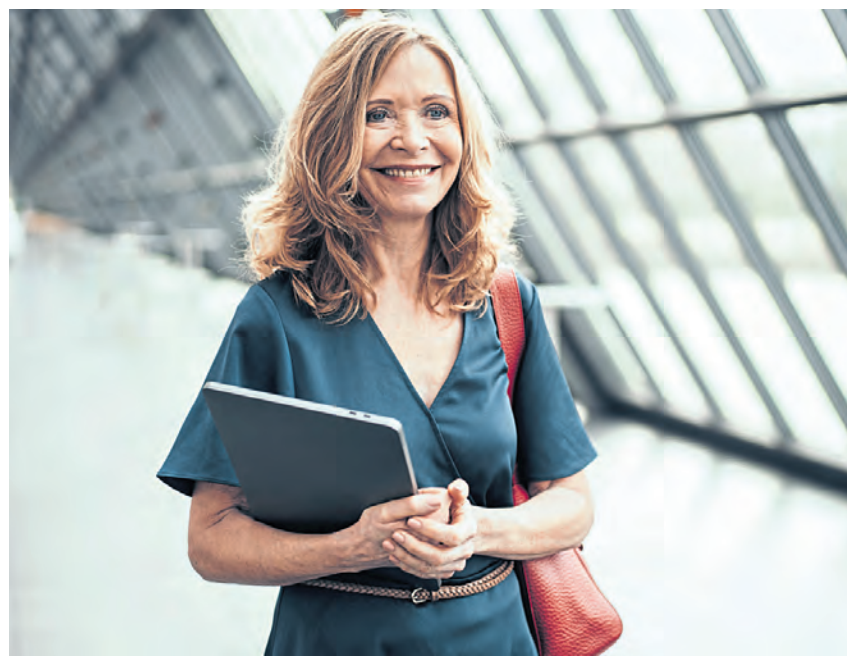
Manchmal ist es nicht so einfach, den richtigen Zeitpunkt zu finden, um in Rente zu gehen.