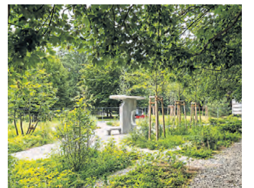
Einer von zwei Treffpunkten.

Viele Unterstützer. Grundlage für den Jüdischen Garten ist der Entwurf der Arbeitsgemeinschaft „atelier le balto“ mit Manfred Pernice und Wilfried Kuehn. Initiator für die Errichtung des Projekts war die Allianz Umweltstiftung, die bereits 2005 den Bau des Orientalischen Gartens und 2011 den des Christlichen Gartens unterstützt hat. Die Baukosten betragen rund zwei Millionen Euro. Die Finanzierung erfolgte mit Mitteln der Axel Springer Stiftung, der Deutschen Bundesstiftung Umwelt und der Allianz Umweltstiftung. Am 24. Oktober werden in zwei kostenlosen, interaktiven Führungen die Pflanzen des Jüdischen Gartens vorgestellt. Die 90-minütigen Führungen finden um 10.30 Uhr und um 14 Uhr statt. Interessierte können sich online anmelden. (red) https://bit.ly/3G3gy00