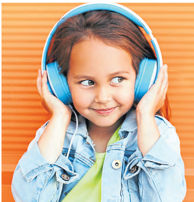
Hörspiele für Kinder und Erwachsene erwarten Berliner in den kommenden Tagen.

Grusel am Lagerfeuer. Die Wagenburg Lohmühle nahe der Görlitzer Brücke lädt am letzten Tag des Festivals, dem 31. Oktober, schließlich zu einem bunten Open Air-Programm am Lagerfeuer ein. Los geht es um 16 Uhr mit einem Kinderprogramm. Ab 18.45 Uhr starten dann die Gruselmomente für Erwachsene. Auf dem Programm stehen „Carmina, der Vampir“ und „Die Legende von Sleepy Hollow“. Der Eintritt ist kostenlos. (kr) www.hoerspielnachte.berlin/