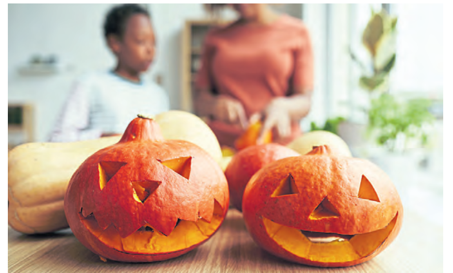
Lecker und vielseitig einsetzbar.

Lange haltbar. Dadurch lassen sie sich gut lagern: Nicht angeschnitten und an einem luftigen, trockenen Ort halten sie mehrere Monate. Wichtig ist dabei eine saubere, unversehrte Hülle, daher sollte man schon beim Kauf darauf achten, dass keine Druckstellen am Kürbis sind und auch der Stiel noch vorhanden ist. Intensiver im Geschmack sind zudem eher kleinere Exemplare. Grundsätzlich gilt bei allen Kürbissen in dieser Jahreszeit: Wenn sie bitter schmecken, sollte man sie auf keinen Fall essen. Der Geschmack der Kürbisse stammt vom giftigen Inhaltsstoff Cucurbitacin, der bei den Speisesorten herausgezüchtet wurde. In selbst gezogenen Kürbissen und vor allen Dingen bei selbst gezogenem Saatgut kann er allerdings wieder auftreten.