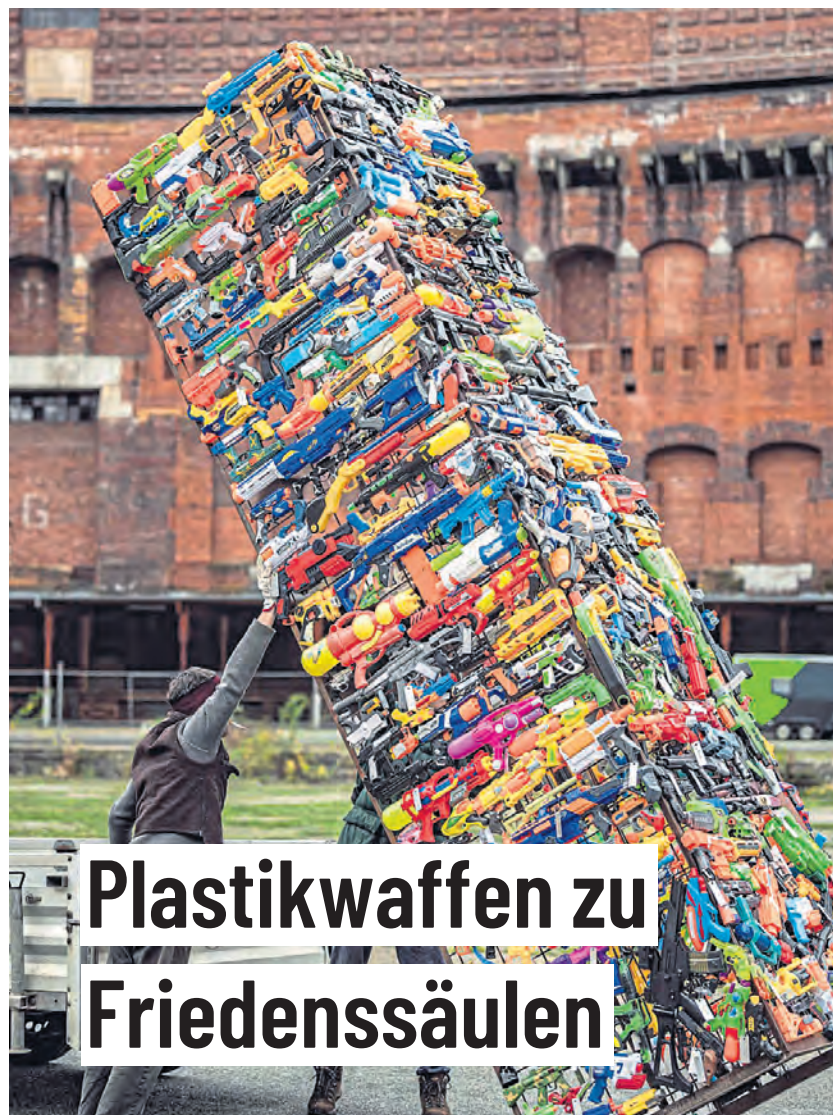
Mitarbeiter des Nürnberger Spielzeugmuseums mit Friedenssäule.