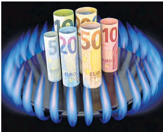
Müssen wir demnächst alle auf kleinerer Flamme kochen?

Auf die Bundesbürger wartet wohl der teuerste Winter seit Jahrzehnten. Die Preise für Sprit, Gas und Strom klettern auf immer neue Rekordstände und eine Inflationsrate von mehr als vier Prozent macht auch Lebensmittel spürbar teurer. Am Ende dieser Preisspirale bleibt die Frage: „Können wir uns das noch leisten?“