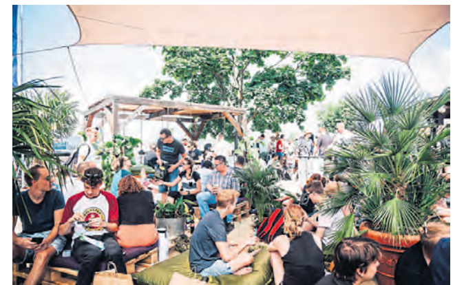
Auf der Hanfmesse geht es relativ relaxt zu.

Einheitliche Regeln. Vor dem Hintergrund der politischen Debatte über eine kontrollierte Abgabe von Cannabis für den Eigenkonsum spricht sich die Co-Chefin der Messe für einheitliche Regeln in ganz Deutschland aus. Nguyen: „Jedes Bundesland hat ein anderes Verständnis darüber, was beim Thema Cannabis legaler Eigenkonsum ist. Der Flickenteppich an Vorschriften gehört vereinheitlicht. Zudem kommt zunehmend gestrecktes und gefährliches Marihuana auf den deutschen Markt. Daher sind Regelungen für eine kontrollierte Abgabe überfällig.“ Mehr Infos zur Messe online. (red) www.maryjane-berlin.com