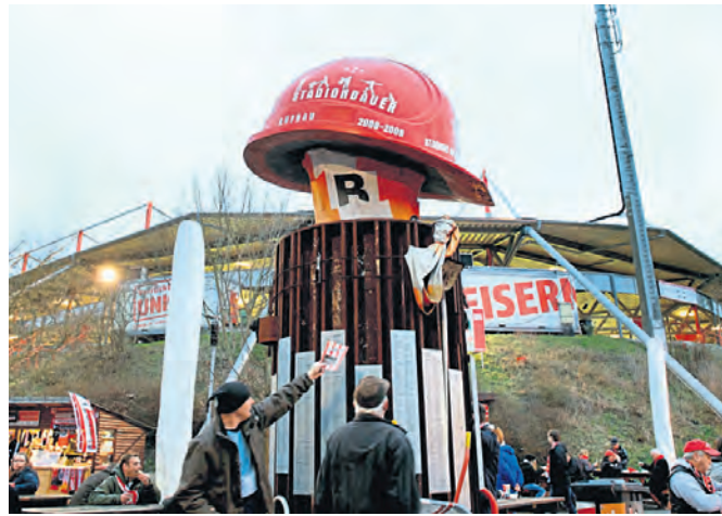
Dieses Denkmal erinnert an die 2.333 Stadionbauer.

Mehrere Geldgeber. Nun gingen sie ans Planen der Finanzen – und kamen zu dem Schluss: Das größte Bauvorhaben in der Historie des Stadions An der Alten Försterei wird voraussichtlich 3,2 – statt der vom Herrn Sportsenator veranschlagten 20