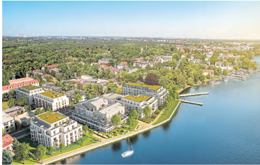
Das Grünauer Gesamt-Ensemble steht kurz vor der Fertigstellung.

Glanzvolles Comeback. „Nachdem dieses Gesamtensemble nahezu verloren gegangen war, ist es nun gelungen, die Seele Grünaus an dieser Stelle wiederzu-