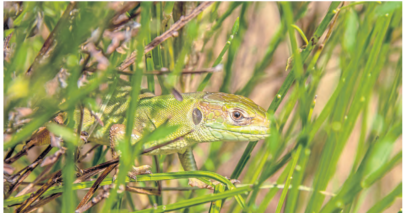
Auch die Waldeidechse soll in den neuen Flächen heimisch werden.