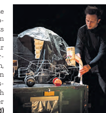
Szene aus „Nichts“.

Information: Krankenhaus Hedwigshöhe, Höhensteig 1, 12526 Berlin, Tel. (030) 67 41 - 0 www.alexianer-berlin-hedwigkliniken.de