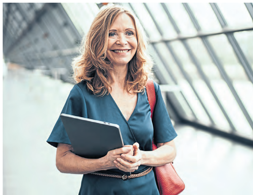
Manchmal ist es nicht so einfach, den richtigen Zeitpunkt zu finden, um in Rente zu gehen.