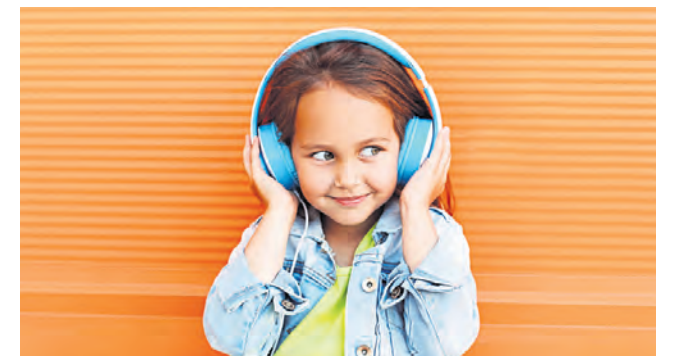
Hörspiele für Kinder und Erwachsene.